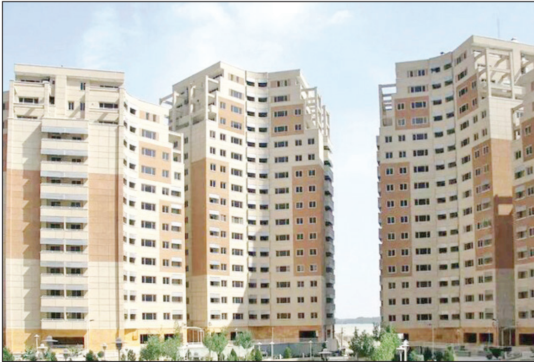
نایب رئیس اتحادیه مشاوران املاک تهران:

رئیس کمیسیون عمران مجلس در پایان گفت: کمیته مسکن کمیسیون عمران با جدیت پیگیری طرح تحقیق و تفحص از بنیاد مسکن انقلاب اسلامی و شرکت عمران شهر جدید پردیس است و هم‌زمان سازمان امور مالیاتی نیز باید اهتمام و نظارت بیشتری در اجرای دقیق قانون اخذ مالیات از خانه‌های خالی به خرج دهد تا از احتکار مسکن جلوگیری شود.